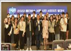
메타버스 서울 시민 서포터즈