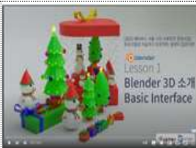
3D오브젝트 제작 교육