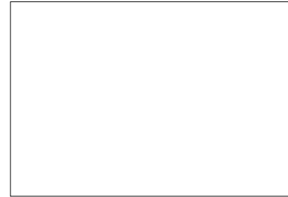
<조성 전 전경>