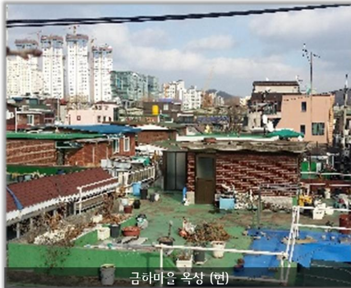
금하마을 옥상 (현)