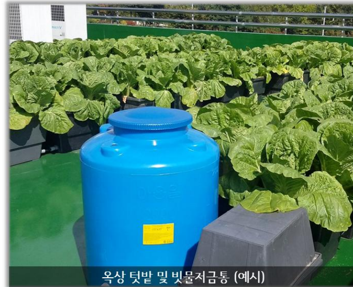
옥상 텃밭 및 빗물저금통 (예시)