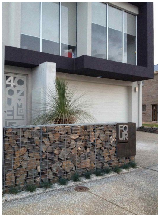
다양하고 마을 특성에 맞는 빗물 이용 및 관리시설