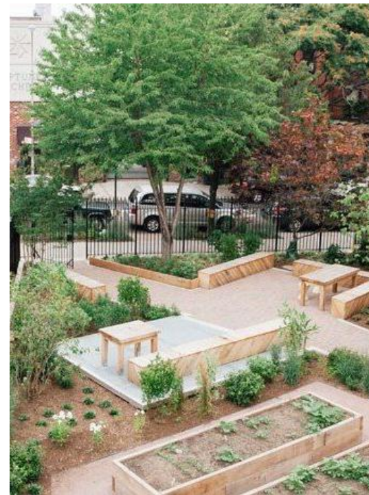
체험 및 교육 프로그램 운영이 가능한 시설, 구간