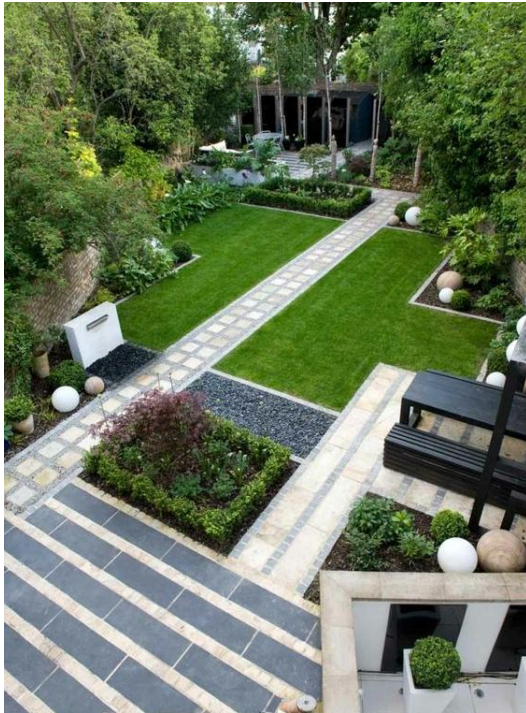
공공시설 활용 그린빗물인프라 제안