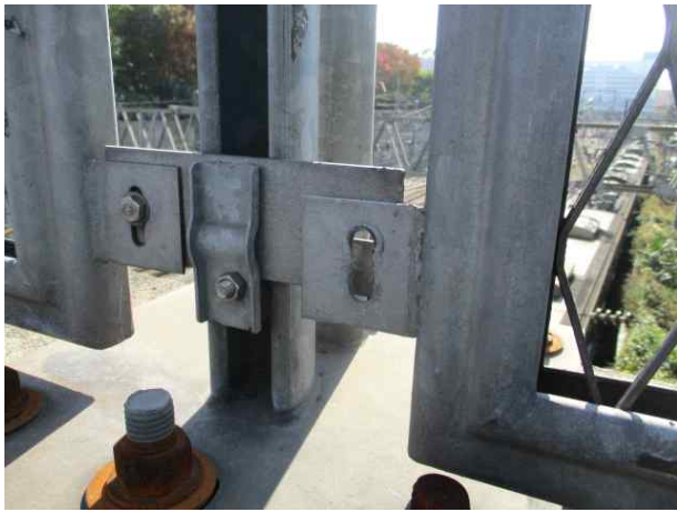
1. 청량 제2고가