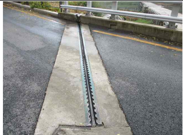
공무직 정비 완료