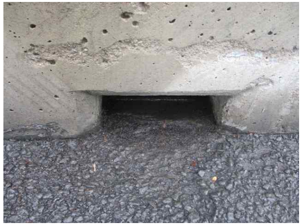
공무직 정비 완료