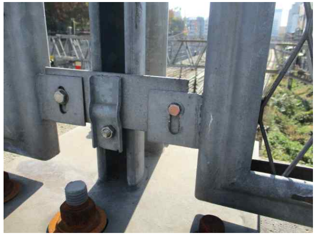
공무직 정비 완료