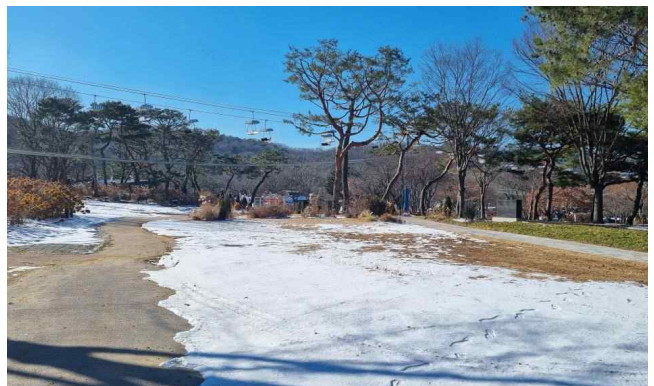
2024 서울대공원 시민정원 공모 예정지(테마가든 내-사정상 변경될 수 있음)