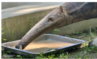
큰개미핥개 맞춤형 영양 공급