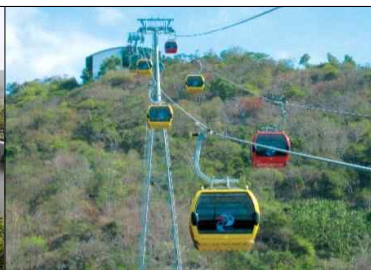
신설 곤돌라 (예시)