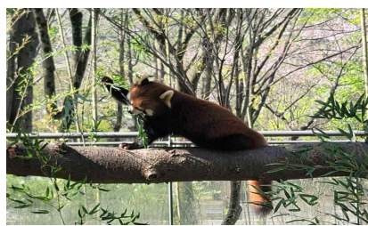
레서판다 안정적인 먹이 수급