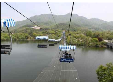
기존 노후 리프트