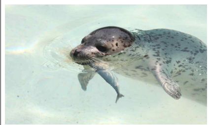
점박이물범 육성기 식단 운영