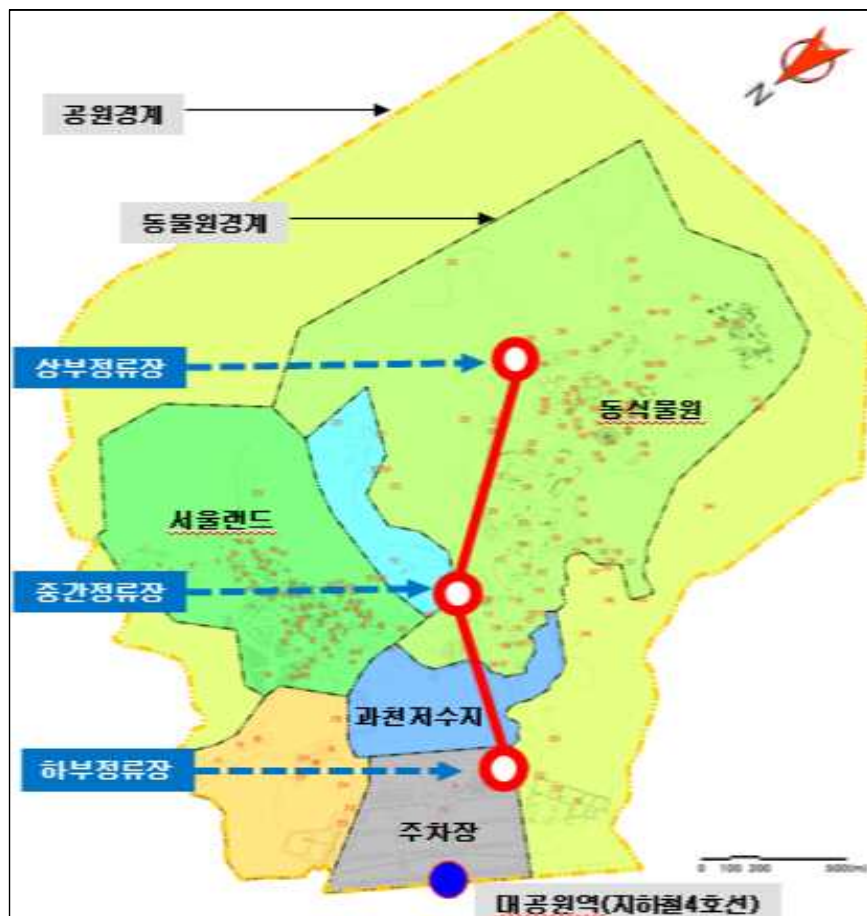
<2016년 개발제한구역 관리계획 변경 노선>

※ 기존 리프트 노선과 동일(단, 하부정류장은 주차장쪽으로 50m 이동)