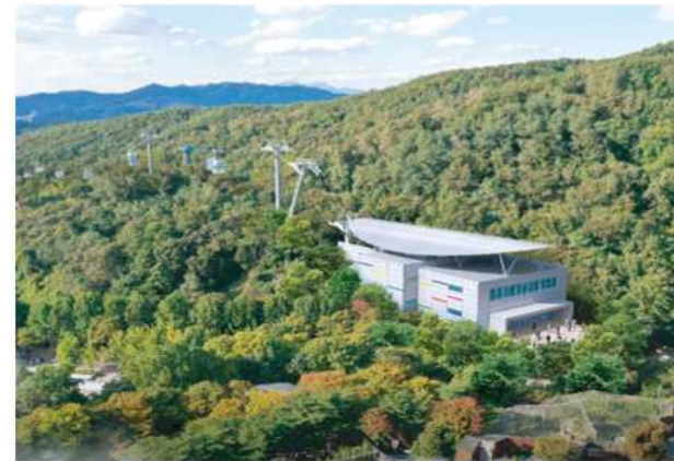
지상 2층(승강장, 근생시설)