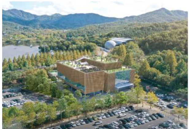
지상 3층(승강장, 사무실, 근생시설)