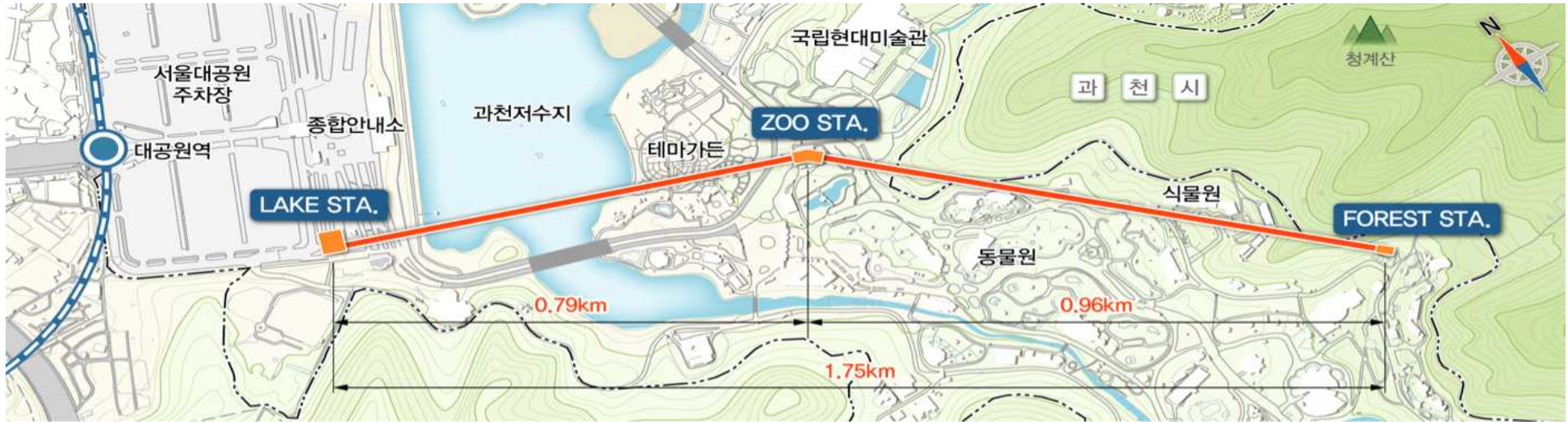
LAKE STATION (하부 정류장)