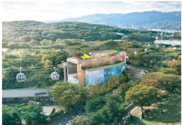
지상 2층(승강장, 대기실, 근생시설)