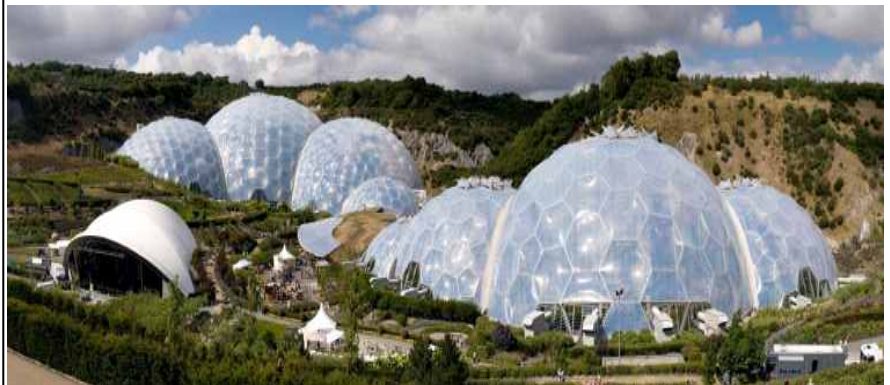
[ Eden Project, Bodelva, England ]