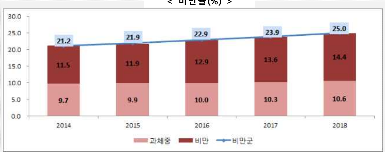
[표-2] 학생식습관 및 신체활동 2) 비율