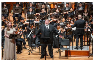
2월 정기공연 (바그너)