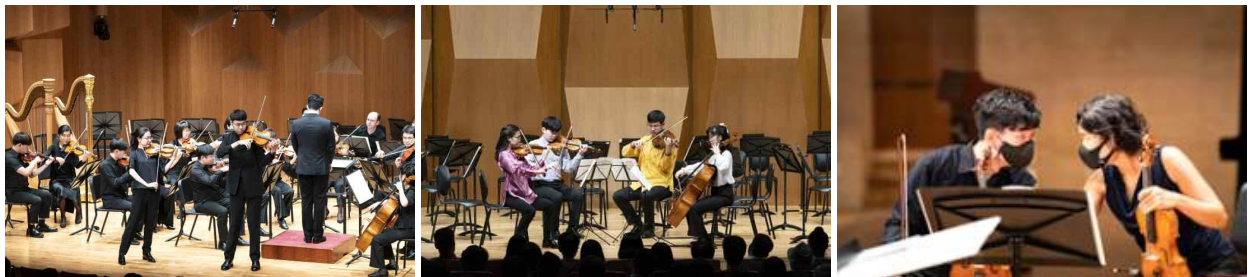
[행복한 음악회, 함께!]