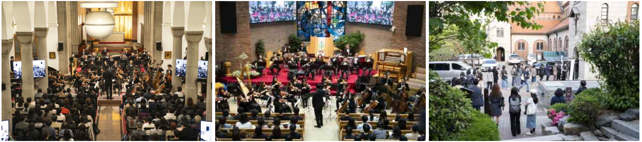
【퇴근길 토크 콘서트】

▶ 장 소 : 대한성공회 서울주교좌성당, 정동제일교회, 경동교회, 남대문교회