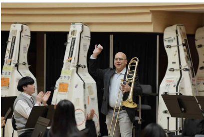
【1.24 트롬본 마스터클래스】