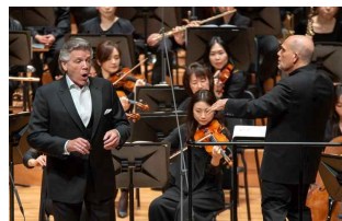
3월 정기공연 (말러)