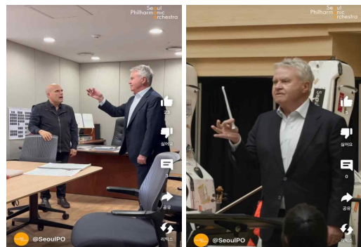
【숏폼 콘텐츠/세로형 영상】