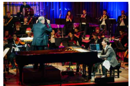
【'23.10. 런던 바비칸센터 공연】