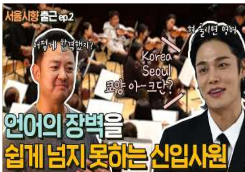
【유튜브 예능 콘텐츠】