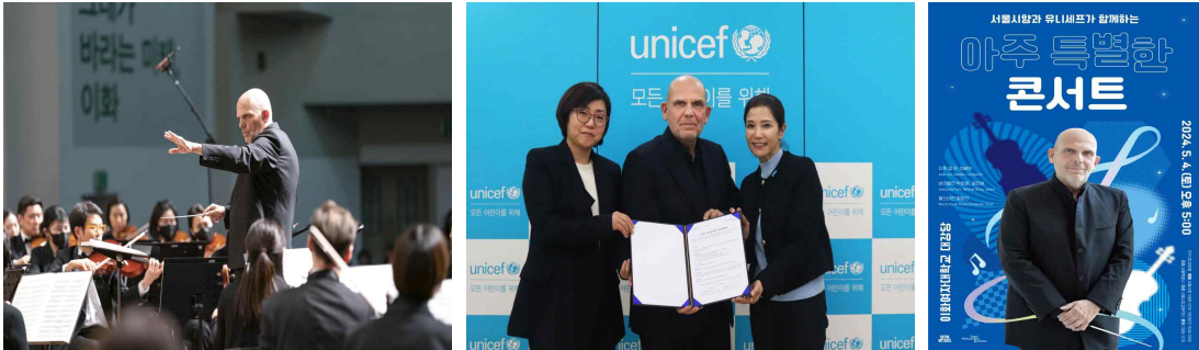
[아주 특별한 콘서트]