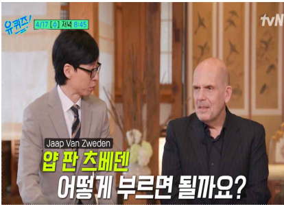
[tvN '유퀴즈 온 더 블럭']