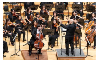
4월 정기공연 (쇼스타코비치)