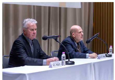
[서울시향 홍보대사 위촉식 및 기자간담회]