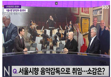
[SBS 뉴스 '나이트라인']