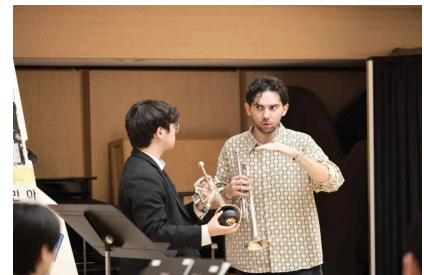
【4.3 트럼펫 마스터클래스】