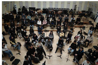
【1.28 호른 마스터클래스】