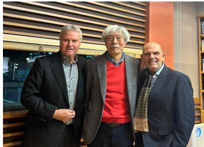
[MBC 배철수의 음악캠프]