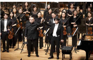
1월 취임 연주회