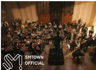
【소녀시대 다시 만난 세계】