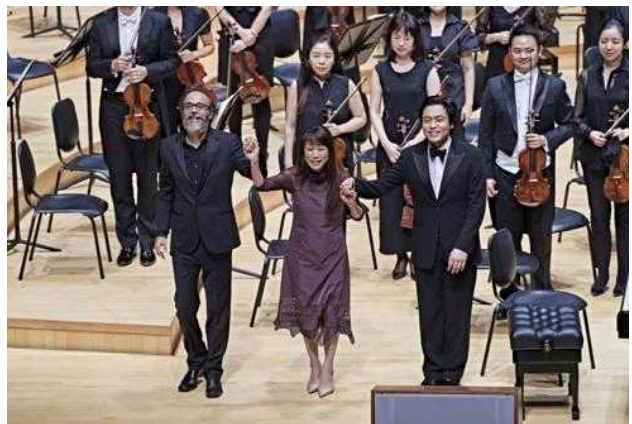
<2017.7.1. 롯데콘서트홀 초청 공연>