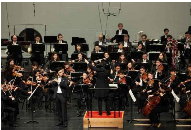
<2017.2.16. 대전예술의전당 초청 공연>