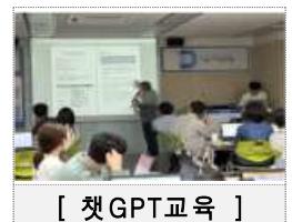
[ 챗GPT교육 ]