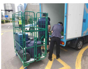
수하물 배송업체 인계