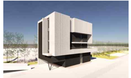
【 조감도 】