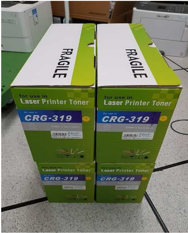
캐논 LBP6303 재생토너(대용량) (4EA)