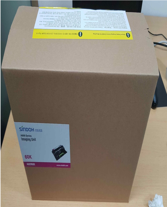
신도 A608 정품드럼 (1EA)