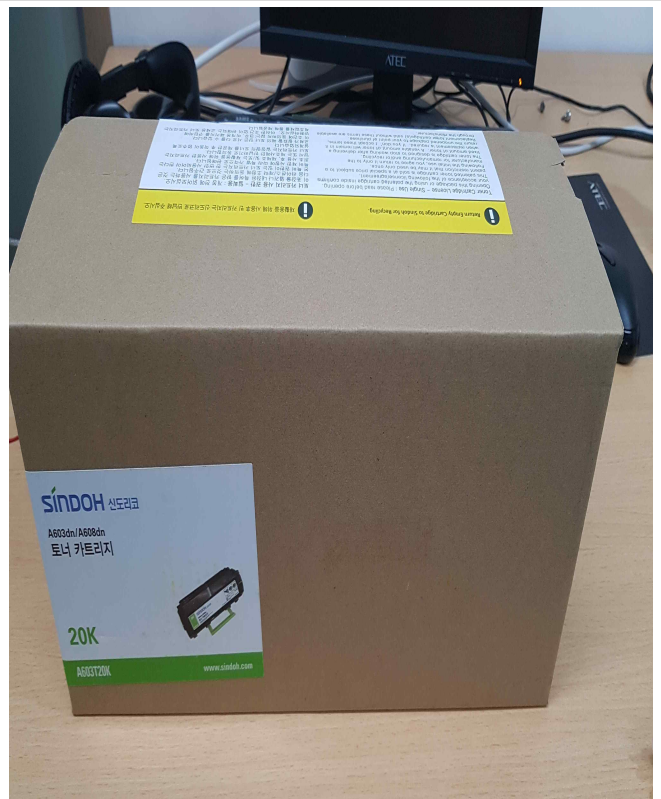
신도 A608 정품토너 (1EA)