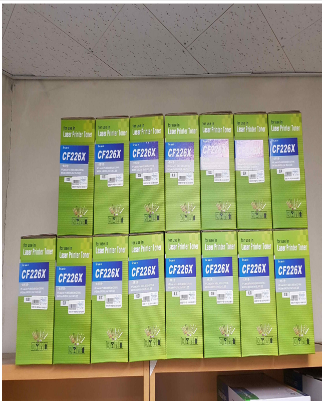
HP M402 재생토너 (15EA)