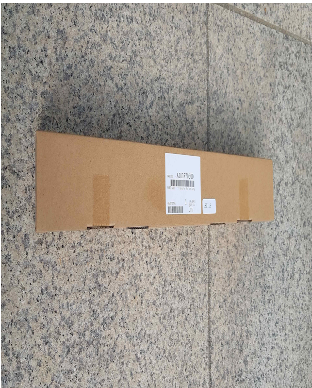
신도 N606 전사롤러 (1EA)