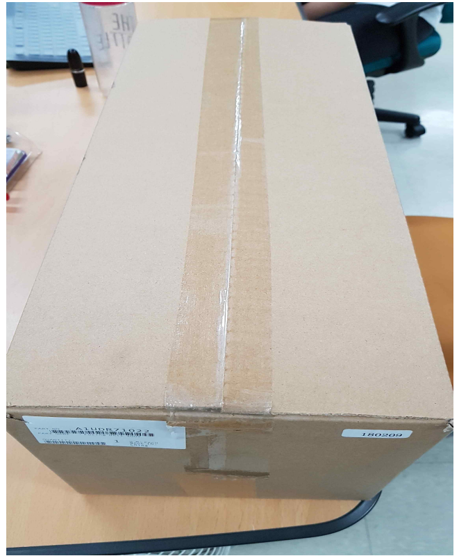
신도 N605 정착기 (1EA)