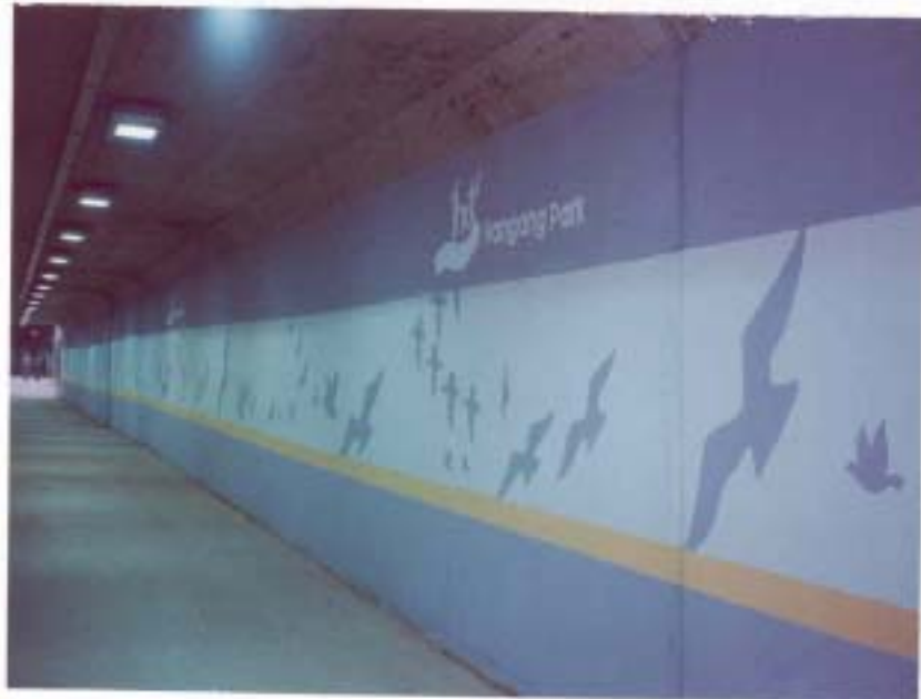
사진설명 강변육갑문 환경개선(그래픽)후 전경