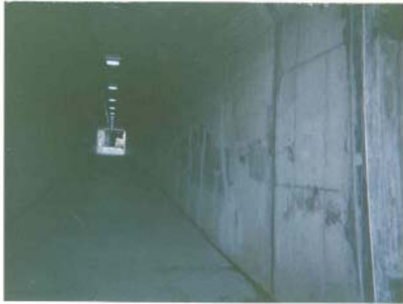
사진설명 강변육갑문 환경개선(그래픽)전 전경