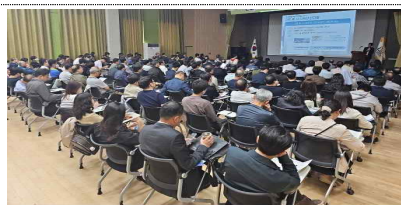
5.13.(서초구청 대강당, 180여명)