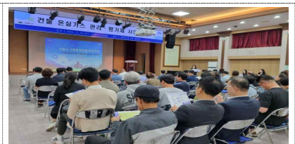
5.16.(강북구청 대강당, 100여명)