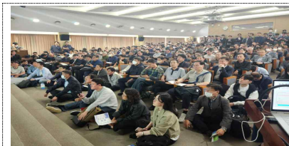
5.8.(서소문청사 후생동, 500여명)