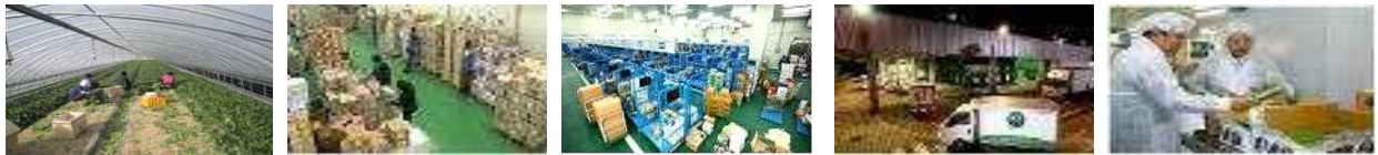
【 생산 】 【 입고(검품) 】 【 학교별 분류 】 【 출고·배송 】 【 학교검수검품 】