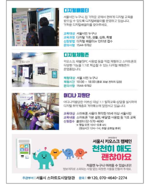
(1월~3월) 전면 안내사, 뒷면 캠페인