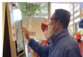
키오스크 사용법 안내