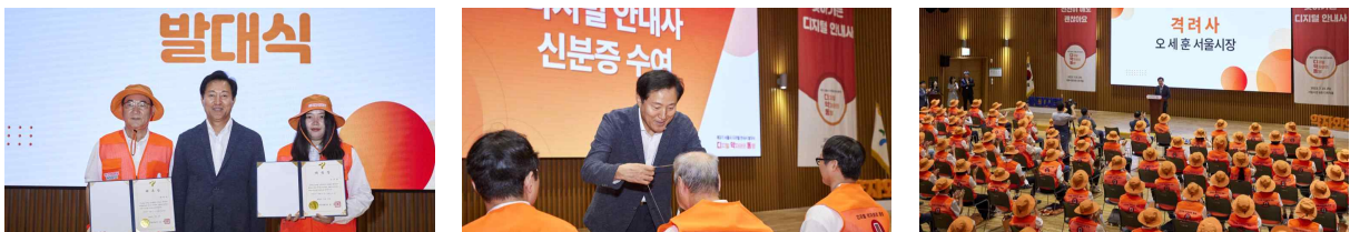
디지털 안내사 3기 발대식('23.7.20)