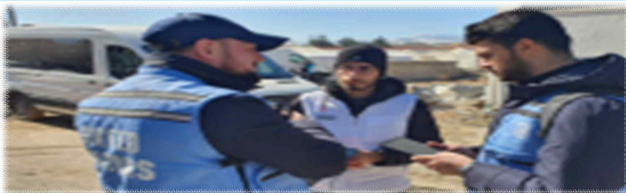
재난 초기 현장 피해평가

※ UNDAC이란 : UN 인도지원조정실(OCHA)에서 관리하는 재난 신속대응 매커니즘, 피해국 정부와 UN을 도와 재난 초기 피해평가 및 지원 국가 간 조정 역할 담당