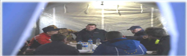
국제기구 재난 대응 회의