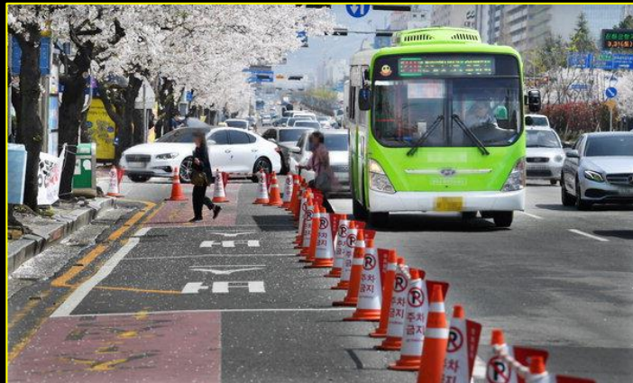
임시 버스 탑승 구역에만 라바콘 설치 및 인력 배치 (이 구역엔 펜스 설치x) *** 펜스설치 시 버스 하차의 방해요소가 될 수 있기때문에 라바콘으로 설치