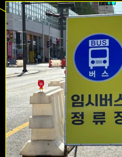
임시버스정류장 안내판 설치(대형 A배너) 임시 버스정류장 및 화살표 크게 삽입