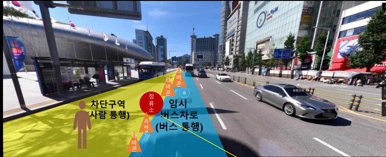
임시 버스정류소 설치 부근