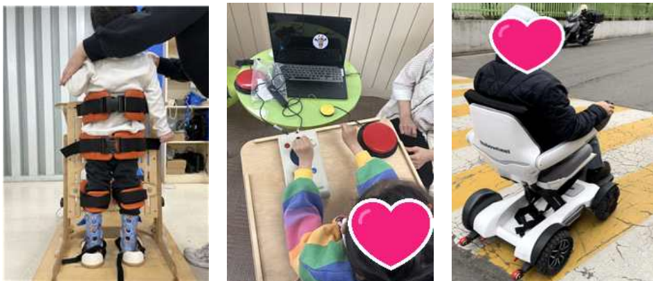
〈보조기기 현장적용 사진〉