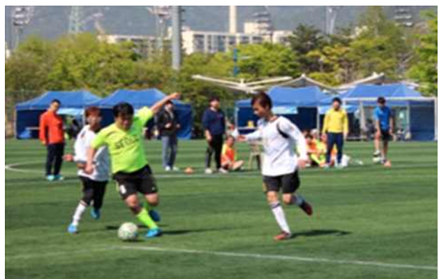
【뇌성마비인 축구대회 사진】