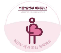
임산부 배려공간 디자인