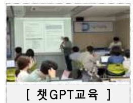
[ 챗GPT교육 ]