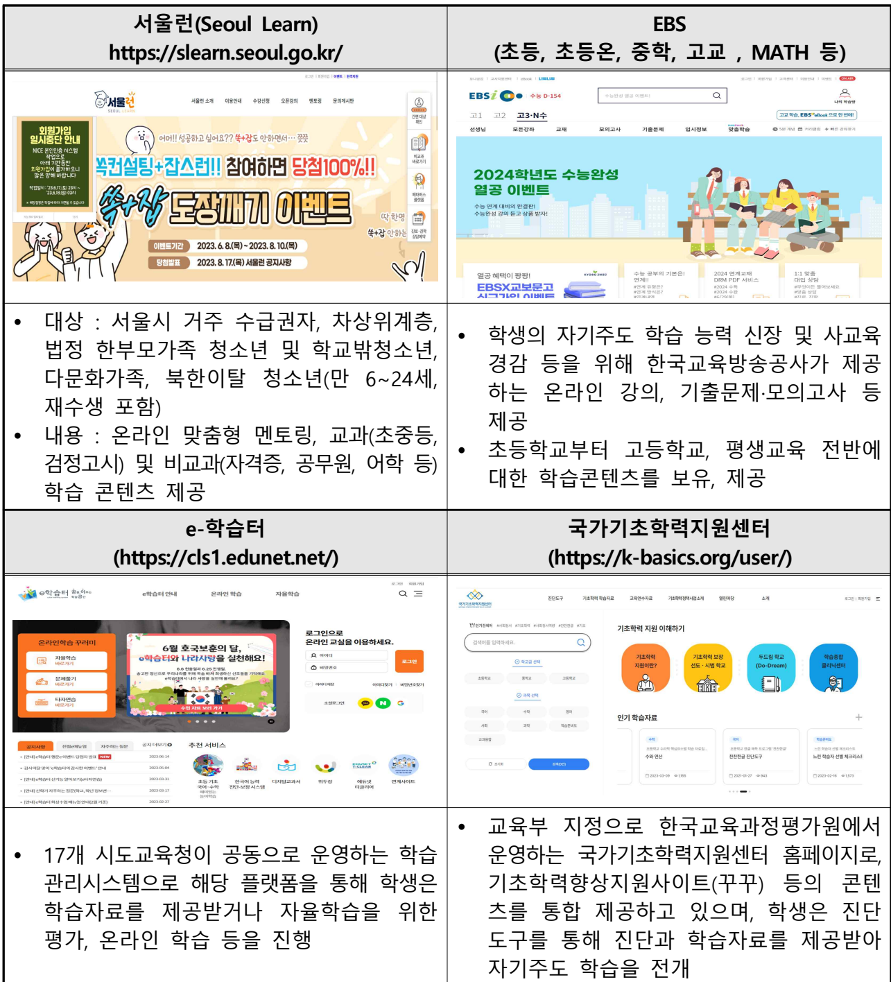
[표-22] 학생 학습지원 관련 주요 플랫폼

디지털 교육 관련 교육부 방침이 구체화되고, 다른 유사 플랫폼과의 차별성이 충분히 확보된 이후에 사업을 추진하는 것이 바람직하다고 판단됩니다.