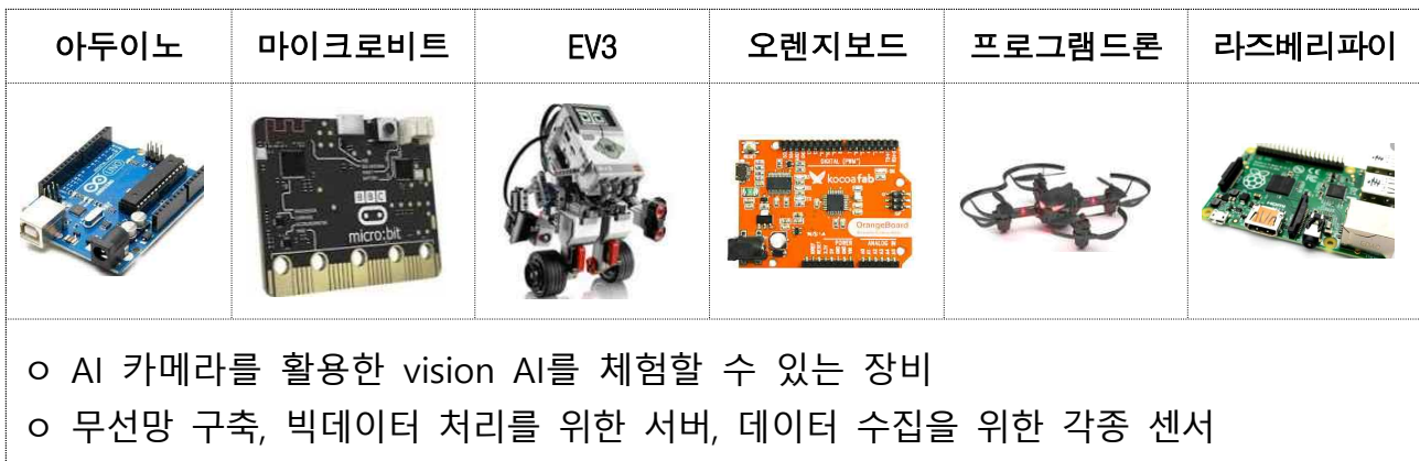
[그림-1] SW·AI캠프운영 관련 구매 교구 예시 27)

○ 또한, 아래 [표]와 같이 학교자율사업운영제(舊 공모사업 학교자율 운영제) 28) 선택영역을 통해 인공지능(AI) 기반 융합교육 프로그램이 운영되고 있고, 학교에 교부되는 기본운영비 안에 정보(SW, AI) 교육 실습비 지원이 포함되어 있는 바, 동 사업을 별도로 추진해야 할 필요성과 실효성에도 중복성 측면에서 의문이 제기됩니다.