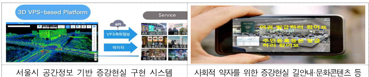
서울시 공간정보 기반 증강현실 구현 시스템