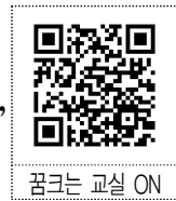
꿈크는 교실 ON