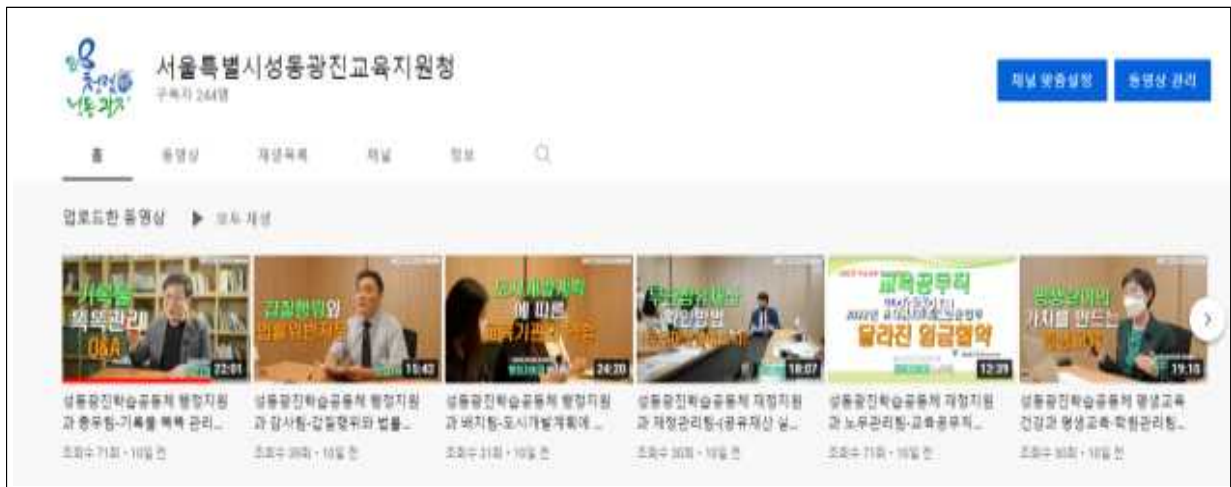
▷ 성동광진교육지원청 유튜브 채널 ‘학습공동체 운영’ 콘텐츠 탑재 썸네일