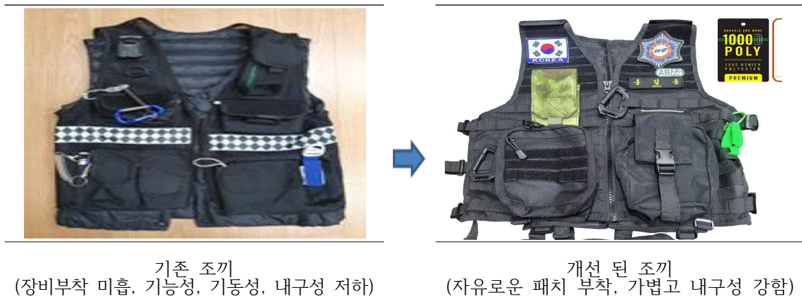
기존 조끼 (장비부착 미흡, 기능성, 기동성, 내구성 저하)