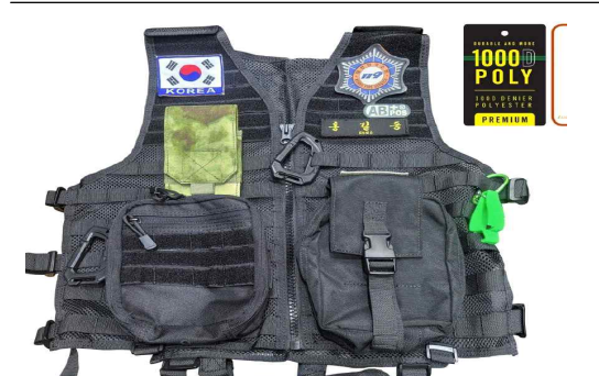
개선 된 조끼 (자유로운 패치 부착, 가볍고 내구성 강함)