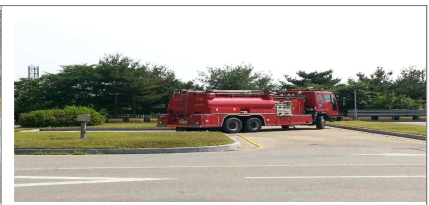
◎◎면허시험장 T 코스