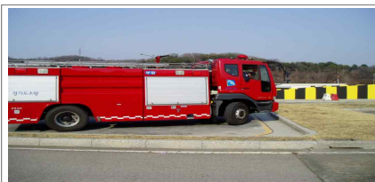
◎◎면허시험장 G 코스