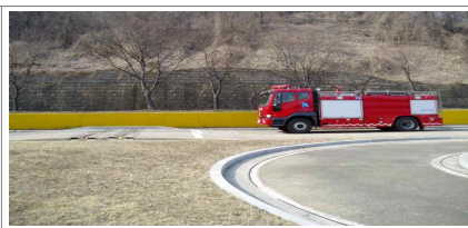
특수코스 주행 교육