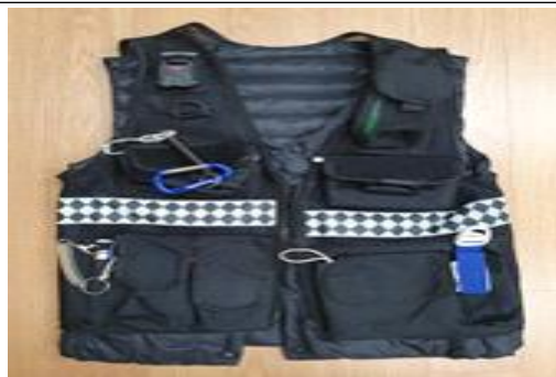
기존 조끼 (장비부착 미흡, 기능성, 기동성, 내구성 저하)