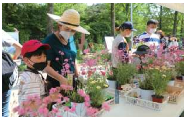
어린이정원 조성체험 프로그램