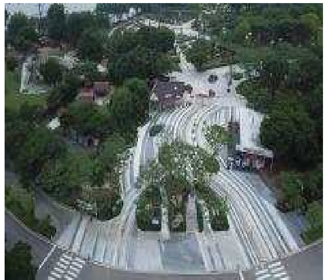
테마가든 입구전경(22년 공사지)