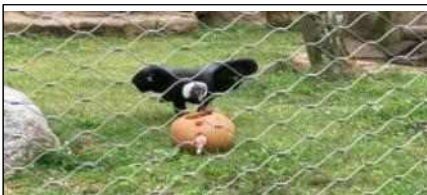
먹이 이용한 행동풍부화 활동