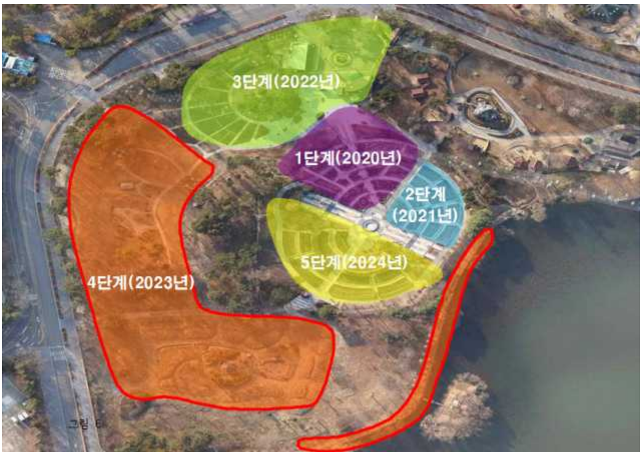
테마가든 단계별 계획(안)