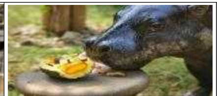
혹서기 대비 특별식 제공