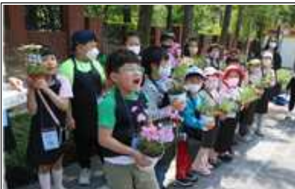
어린이가 만드는 어린이정원