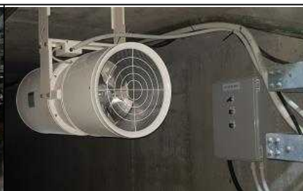
지하구 젯트팬 시범설치