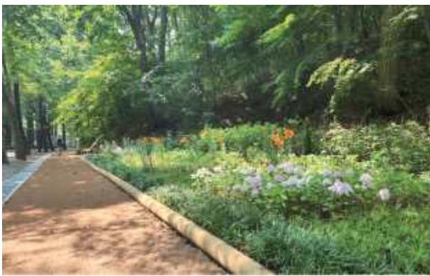
동물원 돌레길 시민가든