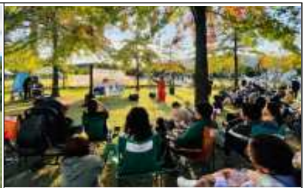
숲 속 콘서트