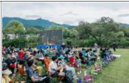
제5회 호숫가 영화제