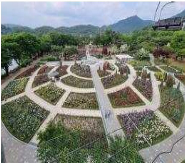
테마가든내 장미원 전경(22년 봄)