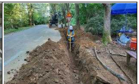
외곽순환로 공원등 정비