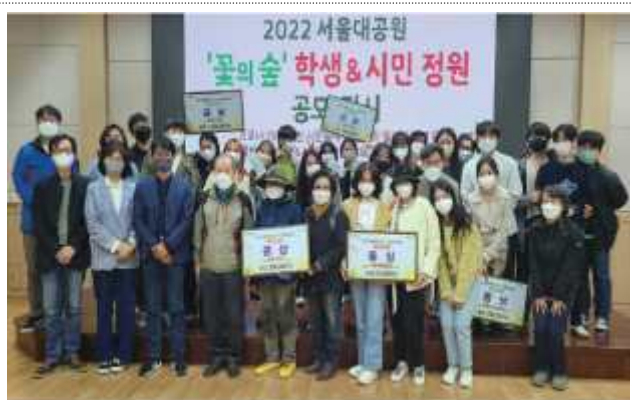
학생·시민정원 공모전 개최