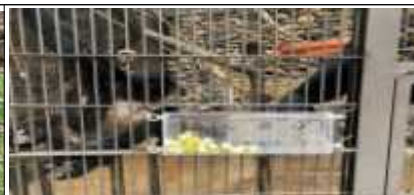
영장류 인지력 향상을 위한 먹이장치 개발