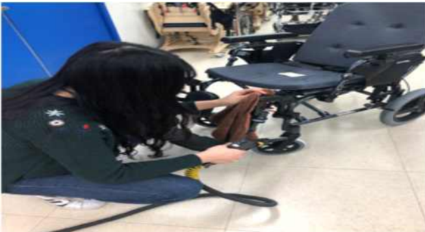
【보조기기 소독·세척 장면】