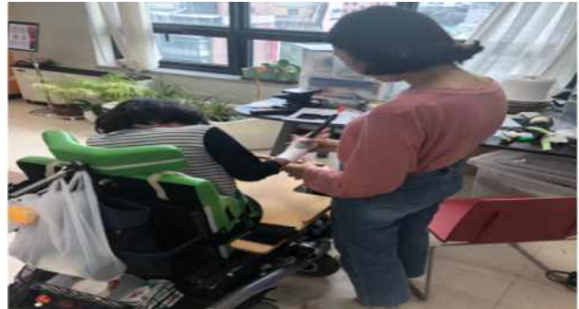
【보조기기 맞춤제작 장면】