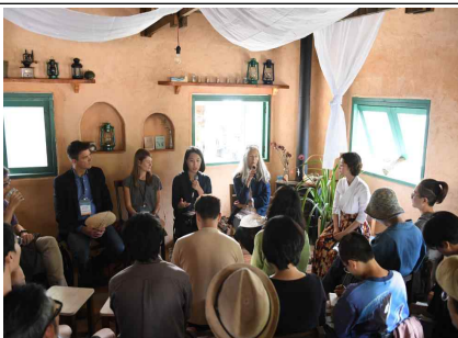
헬레나 특강 및 토론회