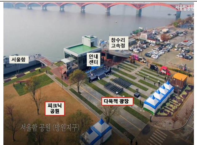
서울함 공원 활용 행사진행 시 모습