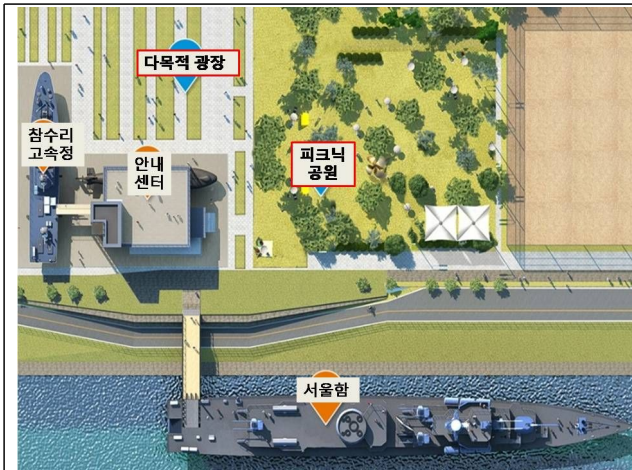
서울함 공원 지도