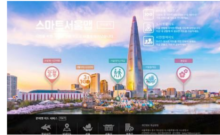
- 서울 IN 지도 홈페이지 -