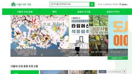
- 서울의 산과 공원 홈페이지 -