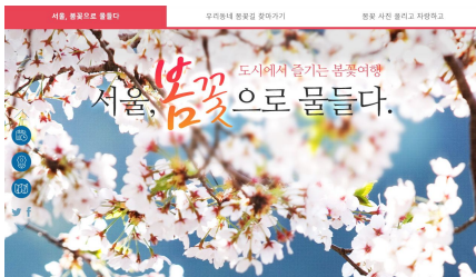
- 서울시 홈페이지 스토리 in 서울 -