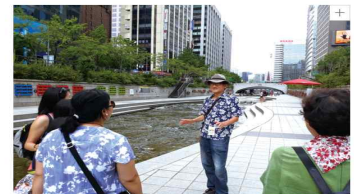
언론매체 취재 지원