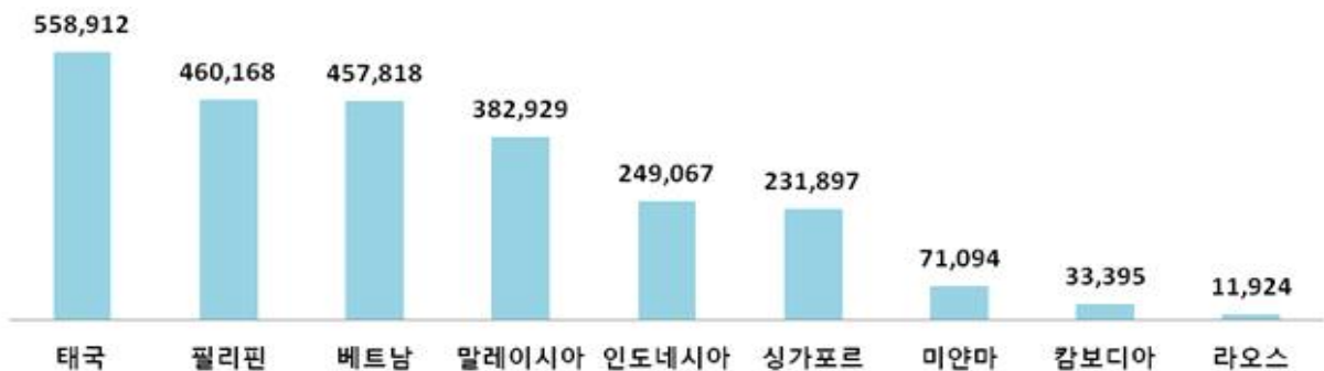
〈2018 동남아시아 국가별 방한 현황〉