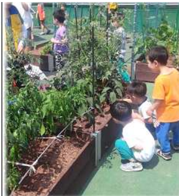
영등포구, 추억을 만드는 공간 '어린이들의 천국'

© 원금희 기자 | © 승인 2017.08.14 15:09 | © 연합뉴스