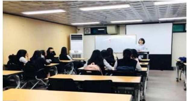
[이후] 학습공간으로 조성, 개방