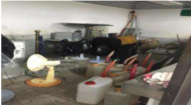
[이전] 창고로 사용하는 지하 공간