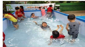
▲ 영등포동 주민센터 어린이 물놀이장 개장

시사경제신문 원금희 기자 - 영등포구(구청장 조길형) 영등포동 주민센터가 어린이들을 위한 다양한 공간을 마련했다. 구는 지난 7일 영등포동 주민센터 옥상 뒷밭 내 '청병청병 어린이 물놀이장'을 개장했다.