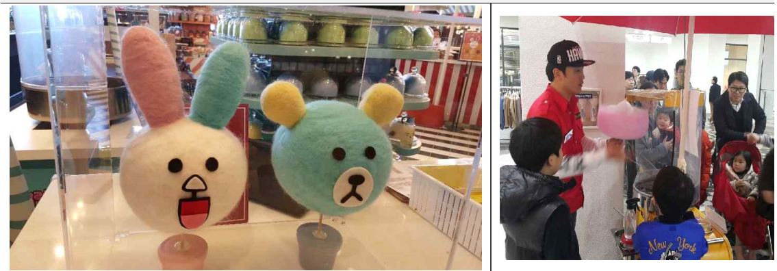
캐릭터 솜사탕 이벤트 이미지