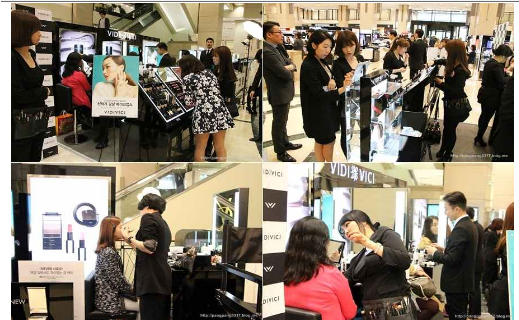
랄라블라 X 메이크업 쇼