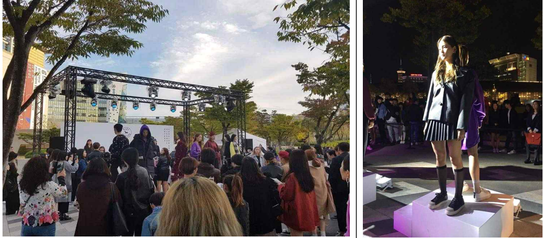
2017 하이서울쇼룸 PT쇼 이미지