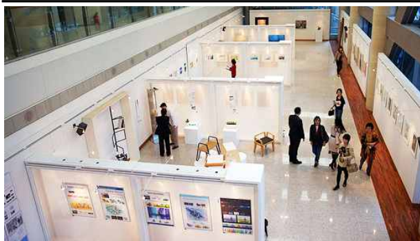
용산아트홀 전시장 전경