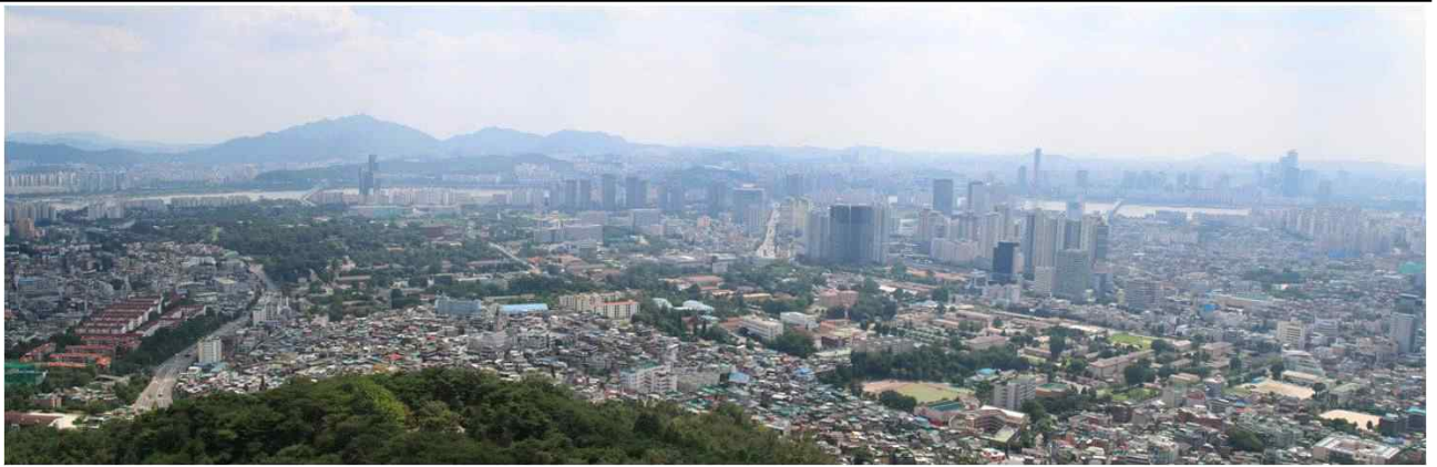
남산공원에서 바라본 용산기지 일대 경관