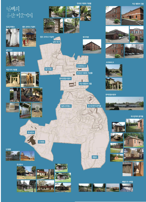
온전한 용산공원 경계구역(안)과 용산기지 내 문화유산적 건조물