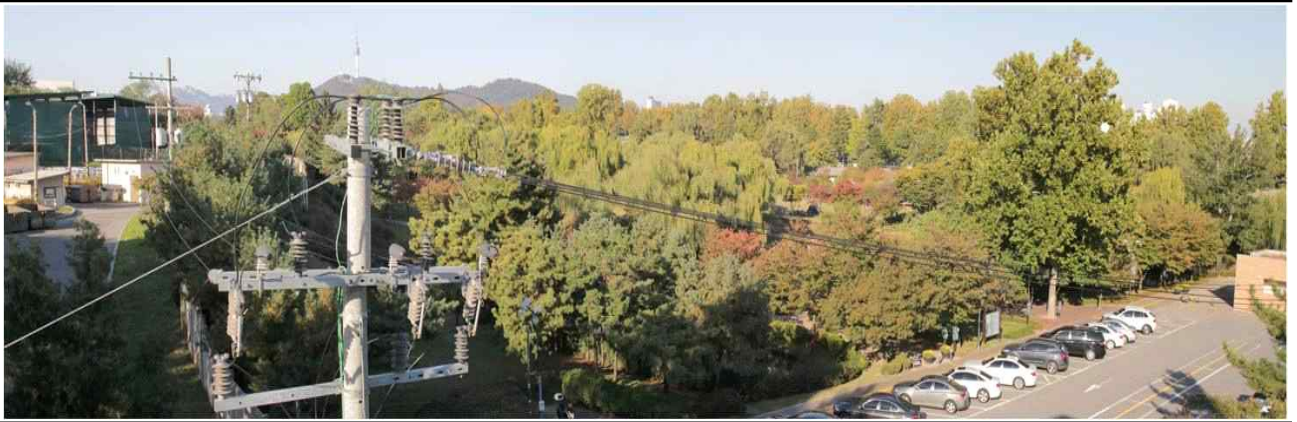
동작대교에서 바라본 용산가족공원 일대 경관