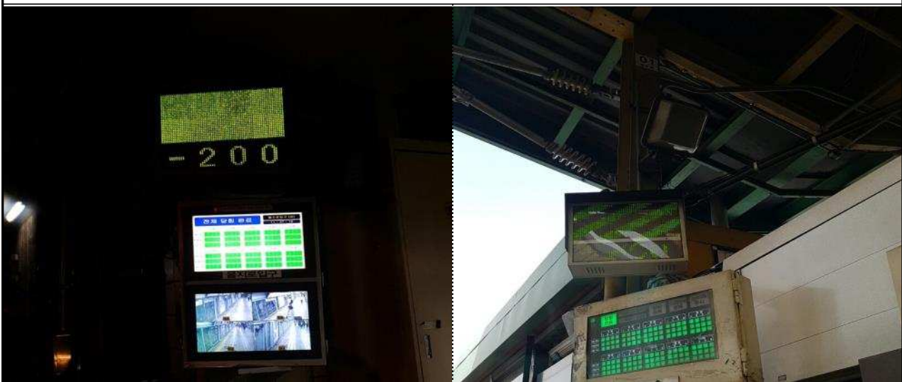
2호선 외선 전체 기관사(승무원)안내장치 정보 및 표출상태 정상 확인