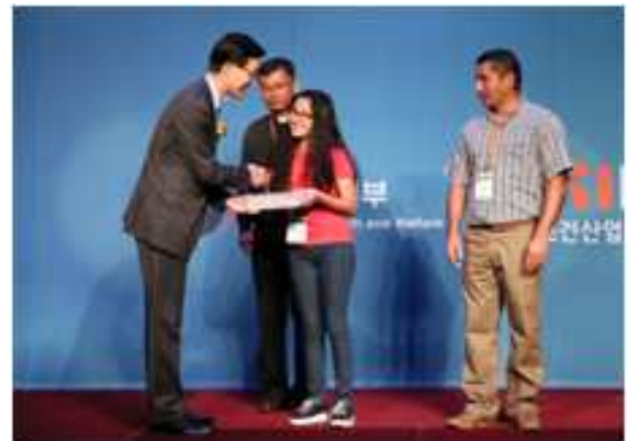
△ 2016 나눔의료 기념행사 - 페루 나눔의료 환아 초청