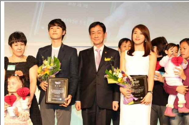
△ 2013 나눔의료 기념만찬 - 배우 송중기, 하지원 초청