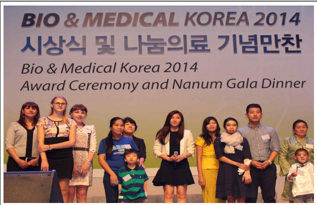
△ 2014 나눔의료 기념만찬 - 배우 하지원 초청