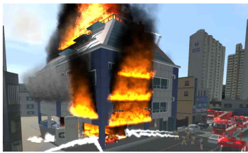
제천 복합건축물 화재