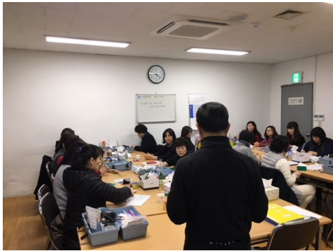
수질측정기 기기사용법 설명 및 실습