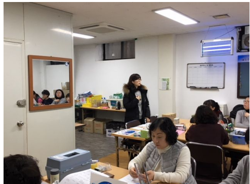
수도 요금관련 민원 대처방법 교육