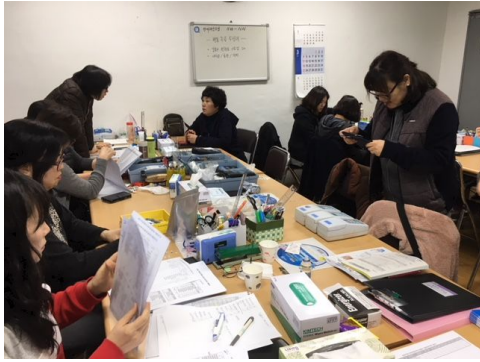
근로계약 체결 및 복무규정 안내