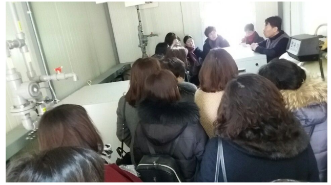
공릉배수지 및 염소분산 주입시설 견학