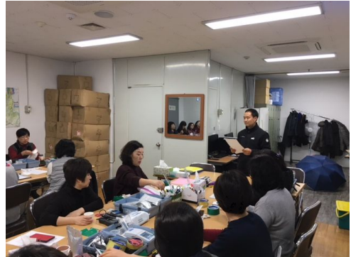
아리수 음수대 구조 및 이해 교육