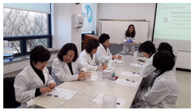
소물리에 교육 (물연구원)