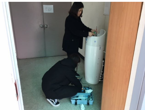
아리수음수대 수질검사 실습