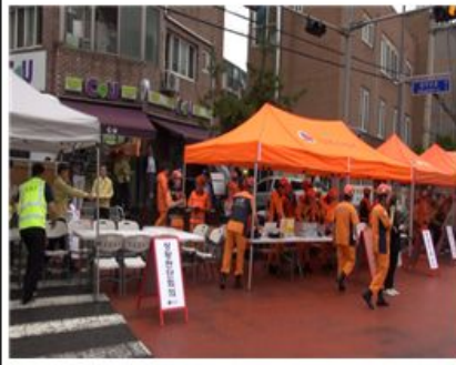
강북구 긴급구조통제단 설치