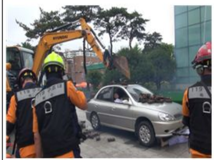
포크레인 이용 매물구조