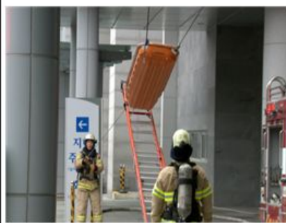
사다리 이용 바스켓 구조