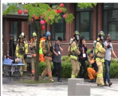
내부 요구조사자 구조