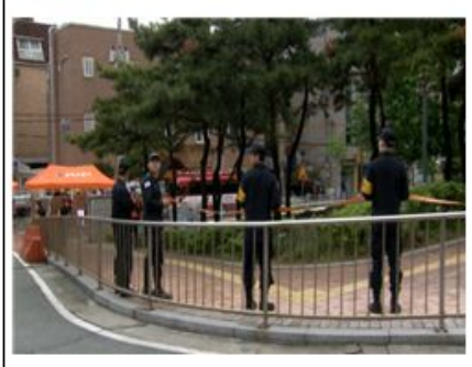
경찰 통제선 설치