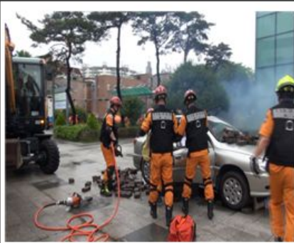
유압장비 활용 차량구조