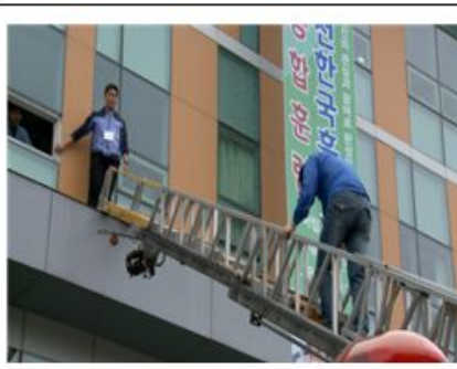
소방사다리 이용 구조