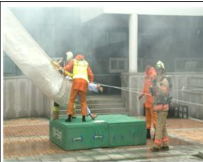
경사식 구조대 구조