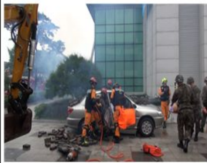
유관기관 협력 구조활동