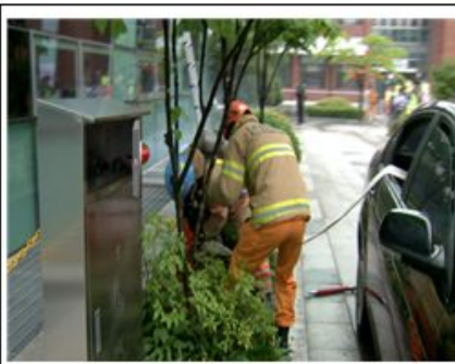
소화전 앞 불법차량 파괴