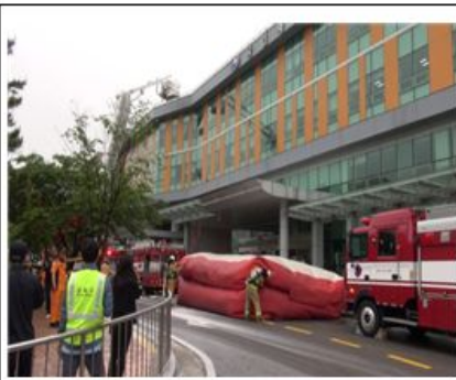
에어매트 활용 구조