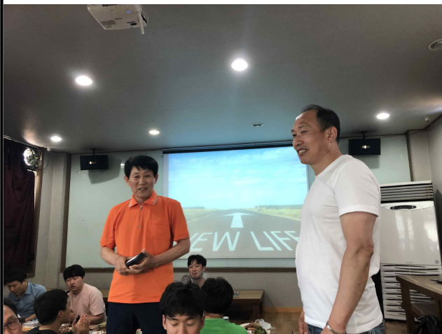
공로직원 감사마음전달 및 소회발표