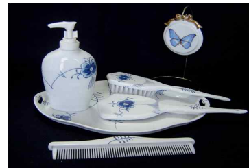
공예박람회에서 포슬린페인팅을 이용한 생활 인테리어 소품 제시