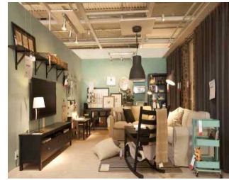
건축, 가구 형태에 따른 공예품을 활용한 다양한 라이프스타일 제안 ※ 가구와 홈 악세서리 브랜드 '이케이' 이미지 활용)