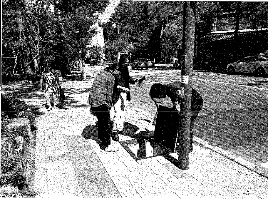
신설맨홀 설치 및 마감상태 확인