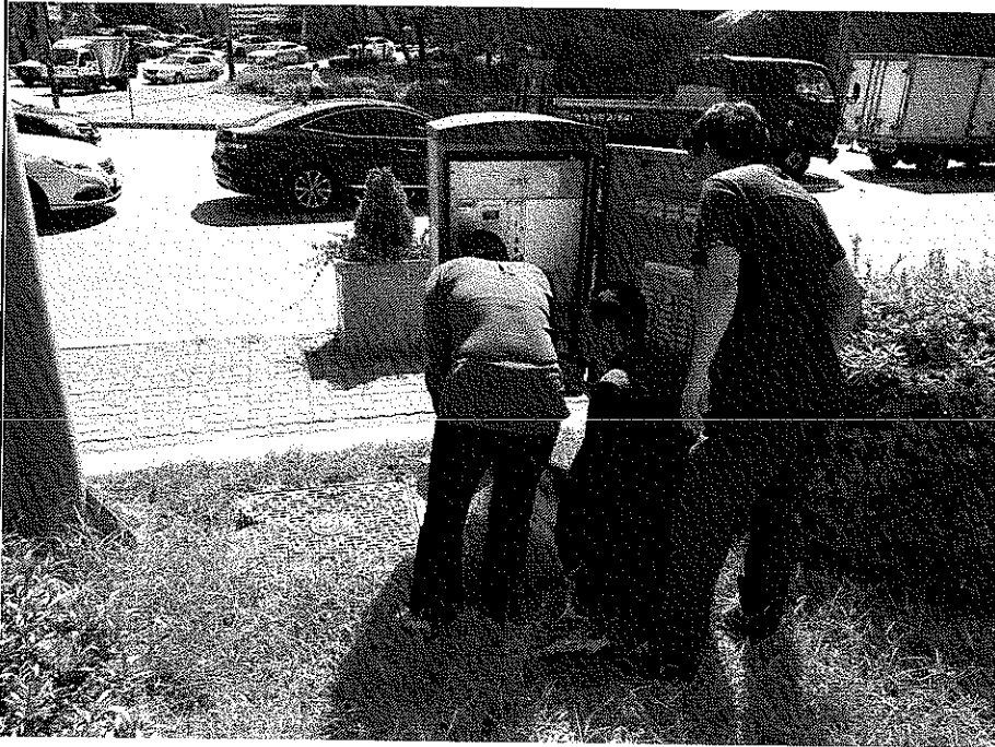
교체제어기 부품수량 및 회선 확인