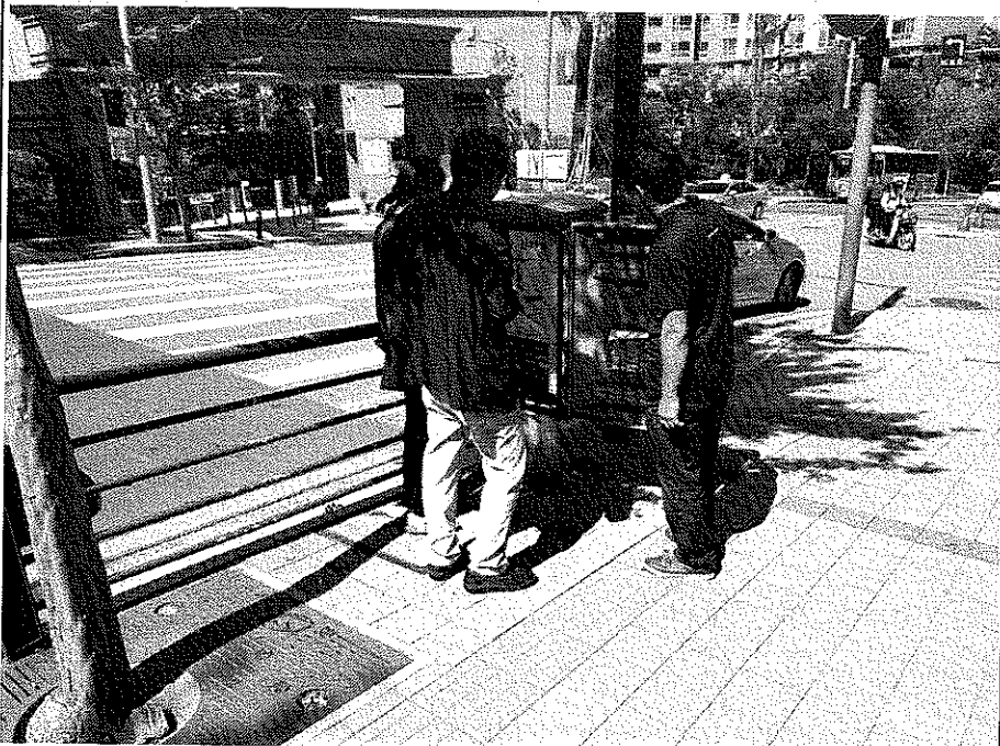
제어기 부품수량 및 DB 상태 확인