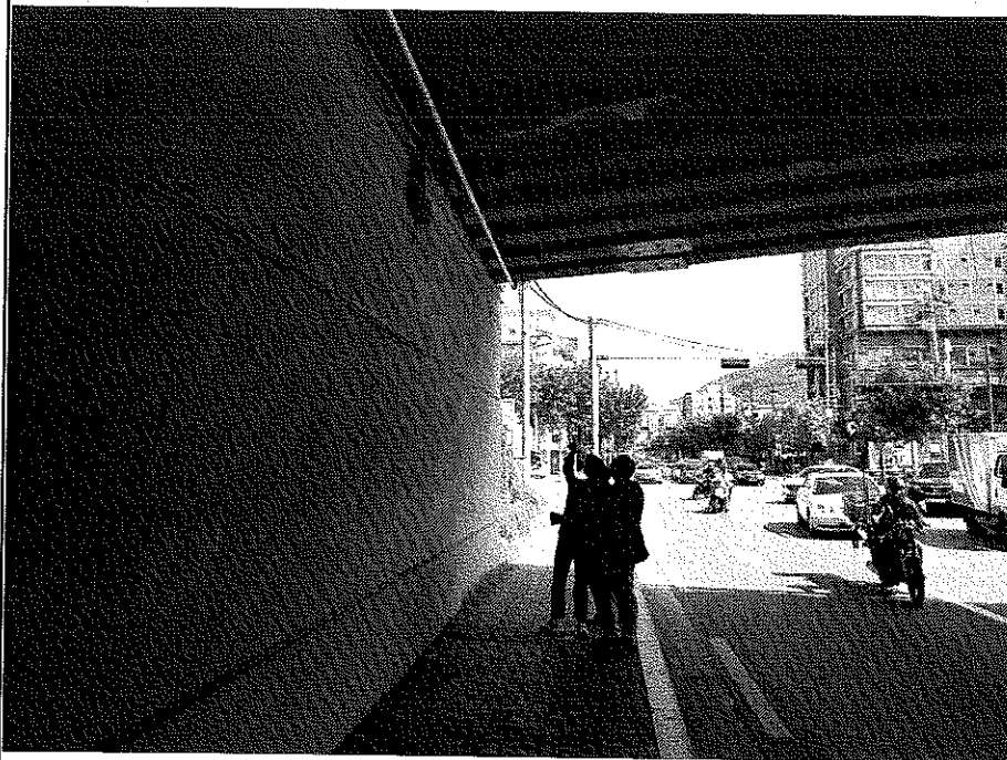
교량하부 STEEL배관 상태 확인