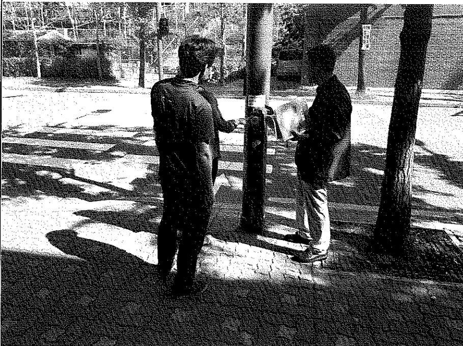
음향신호기 보턴 설치,작동 상태 확인