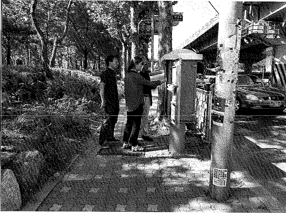
제어기 L.S.U추가 및 LTE구축 상태 확인