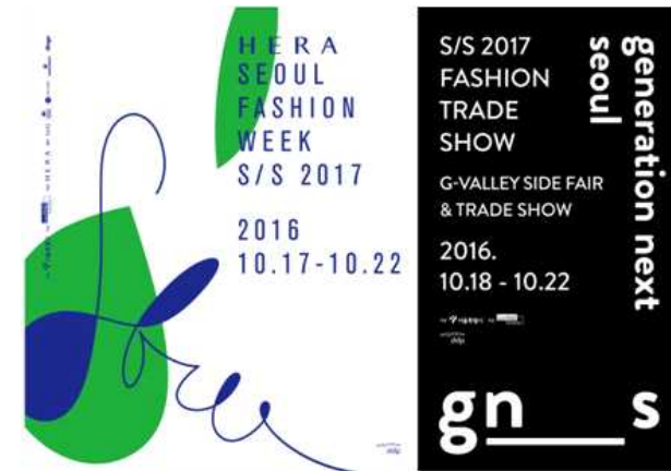
어플리케이션 예시 2) 외벽 대형 랩핑 현수막