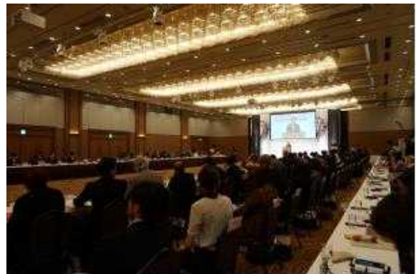
< 유네스코 창의도시 네트워크 정례회의(2015, 일본 가나자와) >