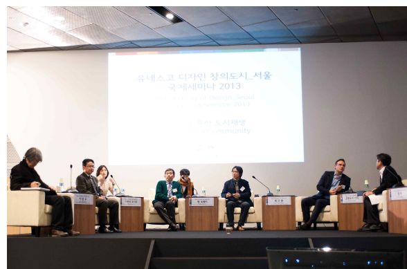
< 제1회 유네스코 디자인 창의도시_서울 국제세미나 (2013) >