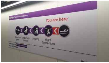
공항 이용 안내사인