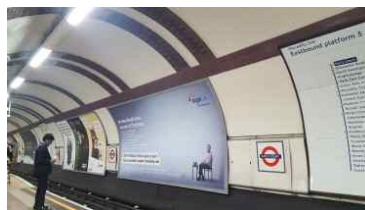
광고면은 승강장 반대편 벽부로 분리