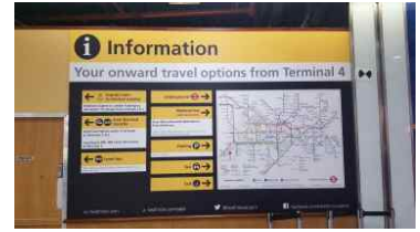
심플한 정보안내 게시판