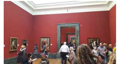
컬러 중심의 공간 구성