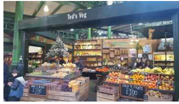
그린컬러로 공간 브랜딩