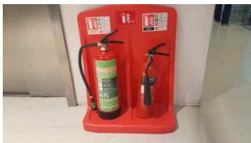
기본적인 소화기 형태