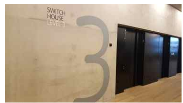
대형 숫자를 사용한 사인체계