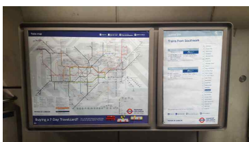
지하철역 버스노선 연계 안내사인