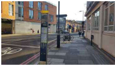
말리본 하이스트리트 초입