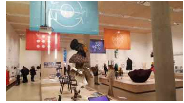
비주얼 디자인 오브 더 이어 전시