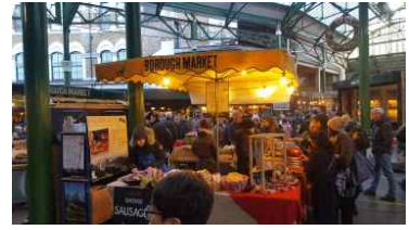
점포별 컬러, 로고를 활용 특성화