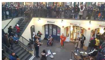
광장부 버스킹 공연