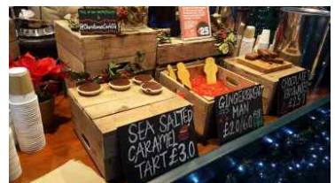
길거리 마켓 사인디자인