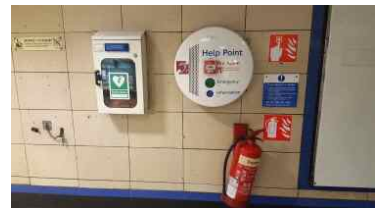
비상벨 및 전화기, 소화기 구역