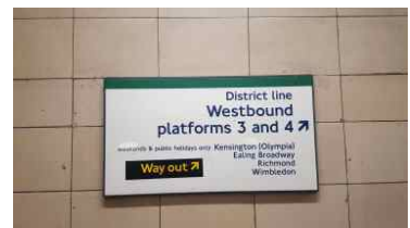
사인은 꼭 필요한 텍스트만 기재