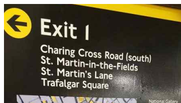
지하철역 출구방향 도로 안내표시