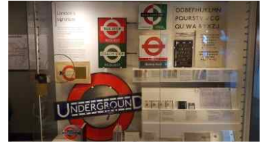
언더그라운드 디자인 히스토리