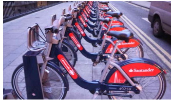
공공 자전거 대여장소