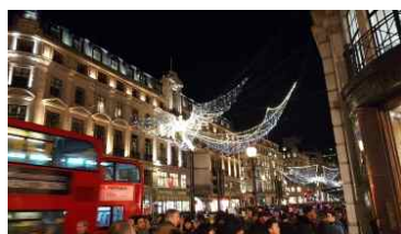
근처 공중 조형물