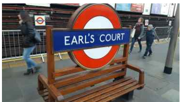
얼스코트역 언더그라운드 사인