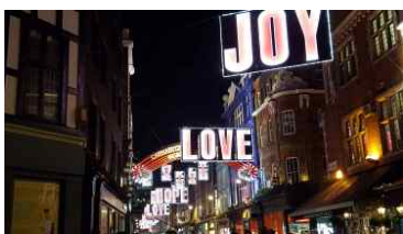
카나비스트리트 메시지 사인