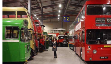
영국 버스 역사관