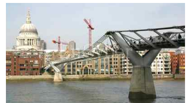
다양한 소재 활용 구조