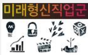
디지털기반 및 사회서비스분야