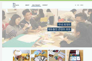
에듀컨텐츠랩 온라인 플랫폼