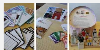
교육생 에듀툴킷 제작